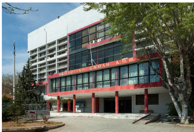
Θεολογική Σχολή, Τμήμα Ποιμαντικής και Κοινωνικής Θεολογίας