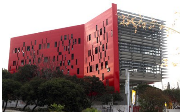
Κέντρο Διάχυσης Ερευνητικών Αποτελεσμάτων (το κόκκινο κτίριο)